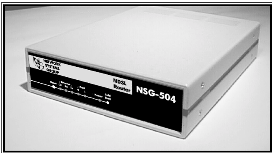
Рис.1 Внешний вид устройства NSG-504

Программное обеспечение и конфигурация хранятся во внутренней Flash памяти и не требуют загрузки при включении питания.